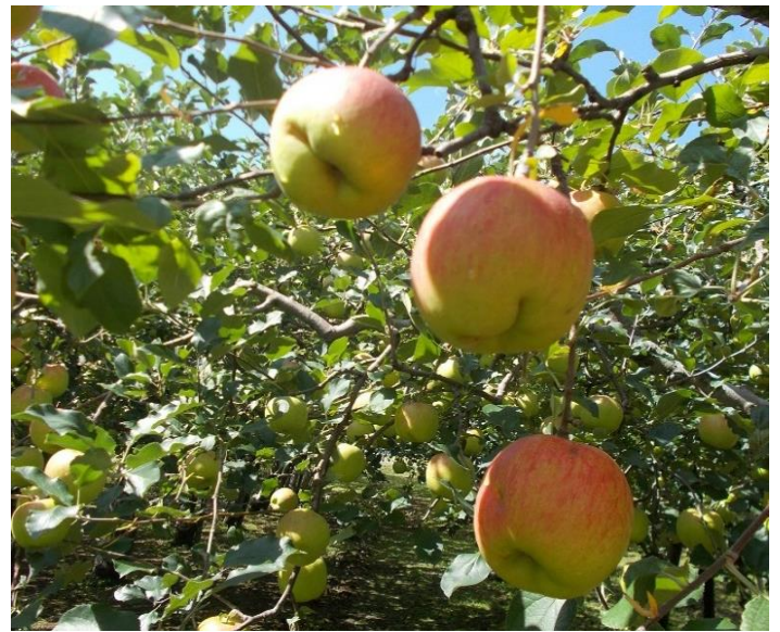
2016年りんご：5月の降雹で甚大な被害となった鹿角市十和田