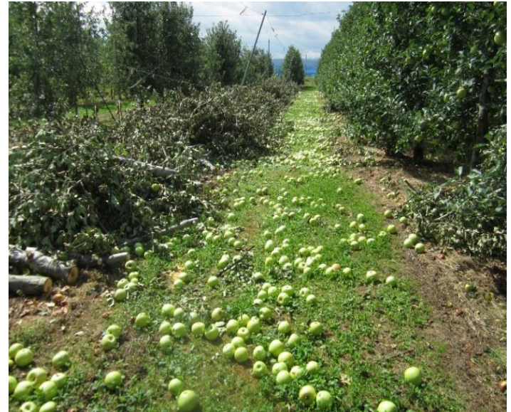
2018年りんご：台風により倒木、落果被害を受けた横手市増田