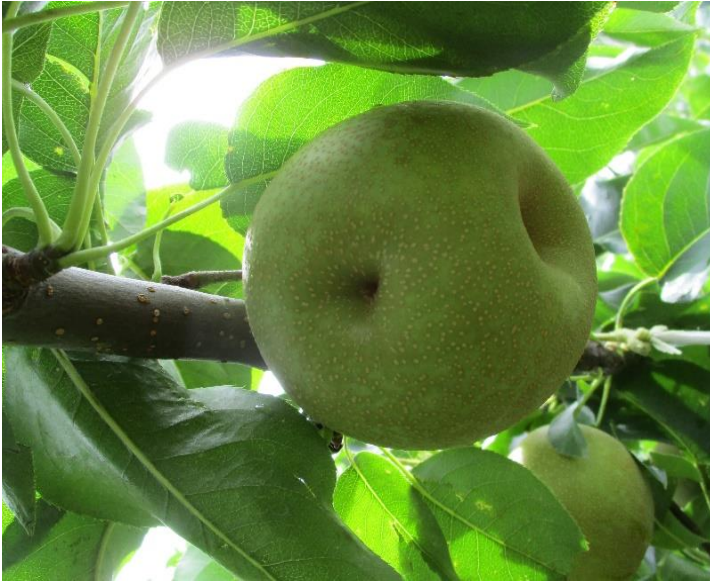
2018年なし：開花期の降雹で甚大な被害となった大館市中山