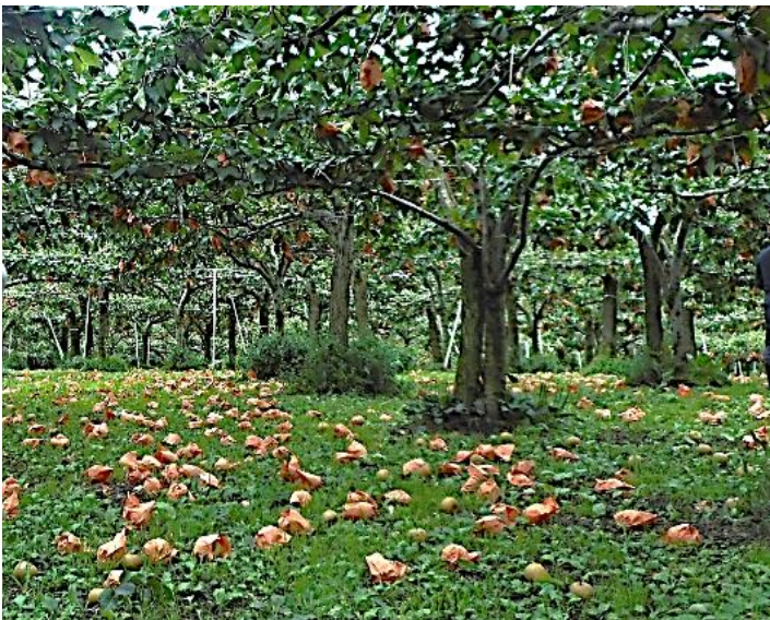
2018年なし：台風21、24、25号で落果被害を受けた男鹿市中石