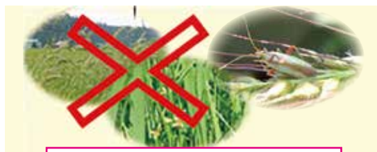
初期の雑草防除に失敗したほ場とアカスジカスミカメの成虫