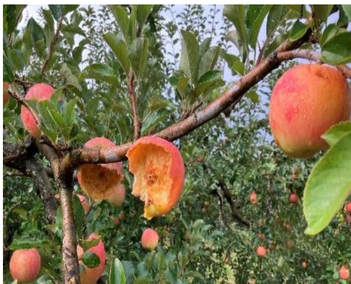
2023年りんご：高温少雨による日焼け、食害が目立った（大館市）