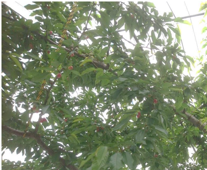
2022年おうとう：開花期の天候不順で結実不良となった（湯沢市）