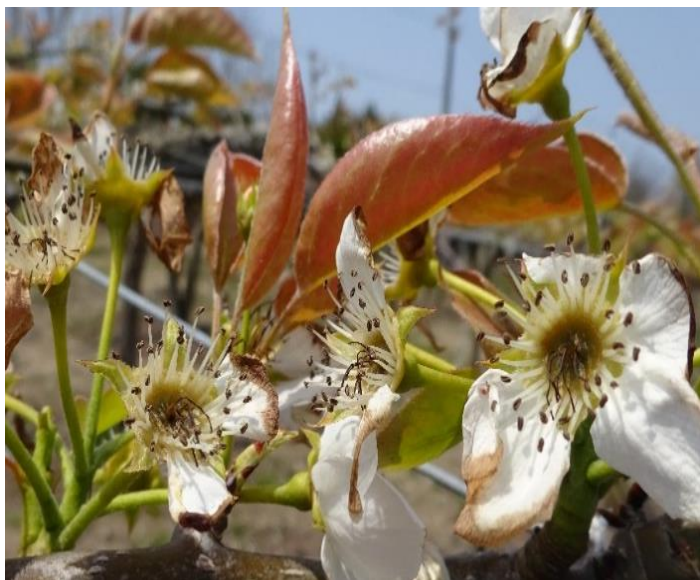
2023年なし：開花期の降霜により花器の枯死が目立つ（潟上市）