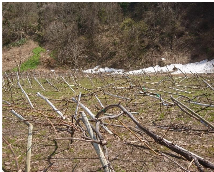
2021年ぶどう：記録的な豪雪でぶどう棚が倒壊した（横手市）