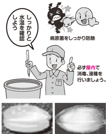
【浸種充分な籾と玄米外観】 胚の状態をしっかりと観察しましょう