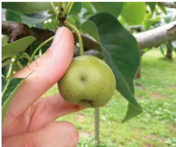
▲ひょう害を受けたナシの幼果 (令和7年7月3日・大館市)