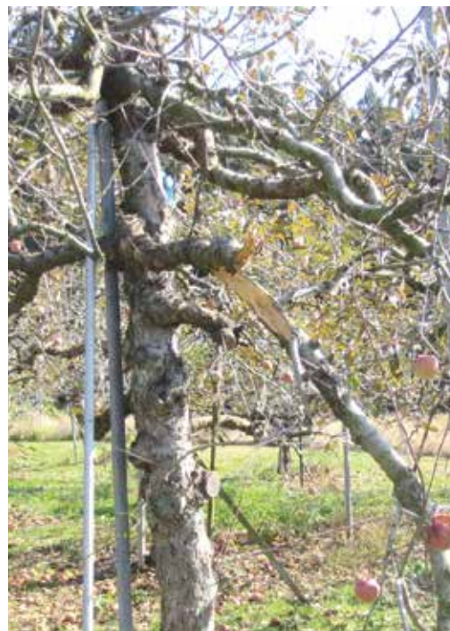
▲クマに枝を折られたリンゴの木 (令和7年10月30日・秋田市)