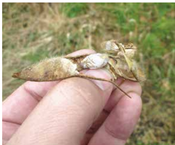
▲高温・乾燥で青立ちが発生 (令和7年11月13日・大仙市)

令和8年産の加入申し込み期限は5月25日です。申込書の提出は期限内にお願いします。