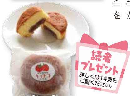
▲キイチゴカップケーキは税込み173円です