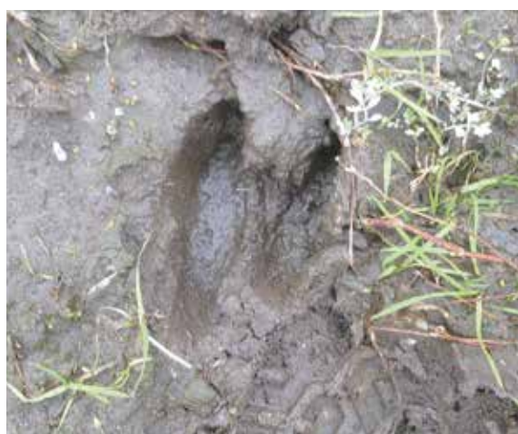
▲圃場に残ったイノシシの足跡 (令和7年11月25日・北秋田市)