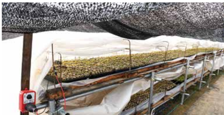
▲1ベッドにトレーを60個置き、4カ所で栽培します。水深は1～2センチです。ハウス内が過湿だと芽が軟化する「トロケ」症状が発生するため、換気が重要です