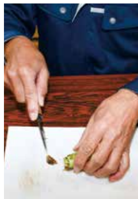
▲根元を水平に切り落とします