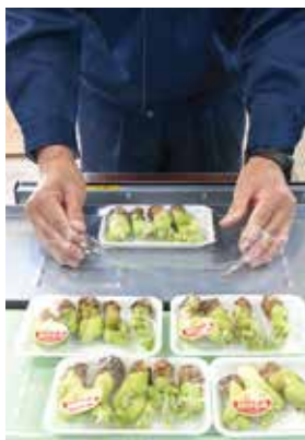
▲パック詰めし、シールを貼って出荷します