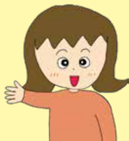
農林水産省公式キャラクター 「しゅうほちゃん」

近年は異常気象による自然災害が増加傾向です。次頁ではつなぎ融資を受けた方の声を紹介いたします