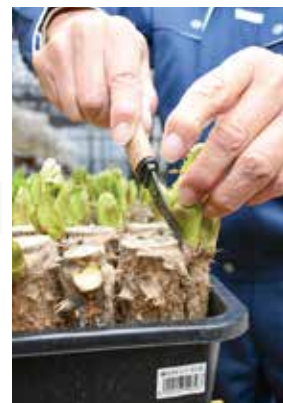
▲ナイフで木肌を削ぐように収穫します