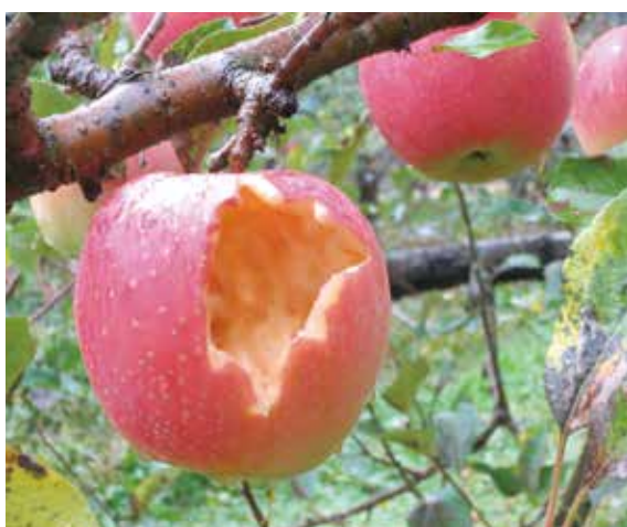
▲野鳥に食い荒らされたリンゴ (令和7年10月27日・北秋田市)