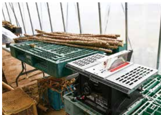
▲株から採取した穂木を電動のごぎり（電動のこぎり）で10～15センチに切断し、駒木を作ります。安全に作業を進めるよう注意を怠りません