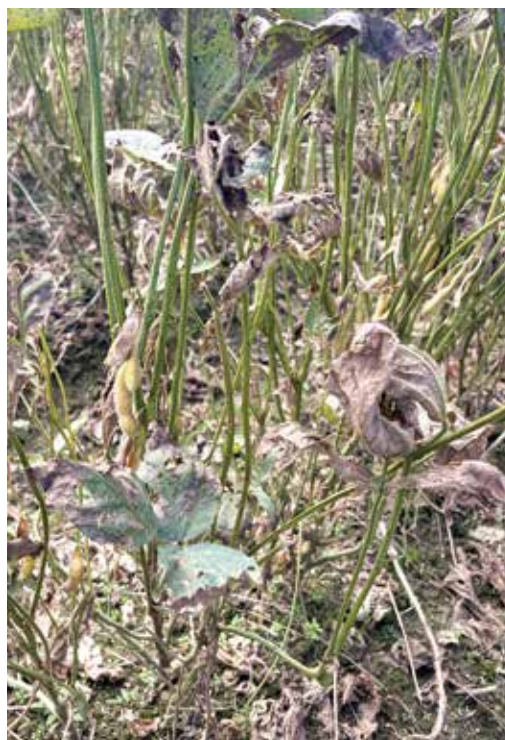
▲前月の断続的な降雨で生育が停滞 (令和7年10月9日・北秋田市)