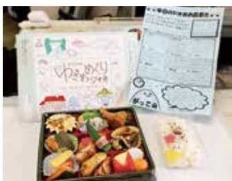
▶品書きには料理や景観の丁寧な解説を掲載